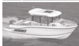
Merry Fisher 795 marlin