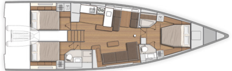
LOWER DECK - 3 CABINS / 2 HEADS PONT INFÉRIEUR - 3 CABINES / 2 SALLES D'EAU