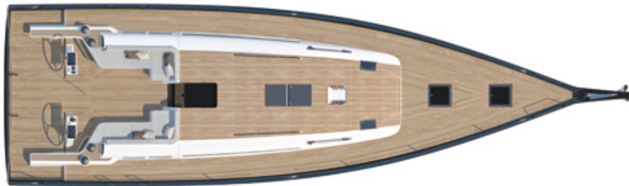
MAIN DECK PONT PRINCIPAL