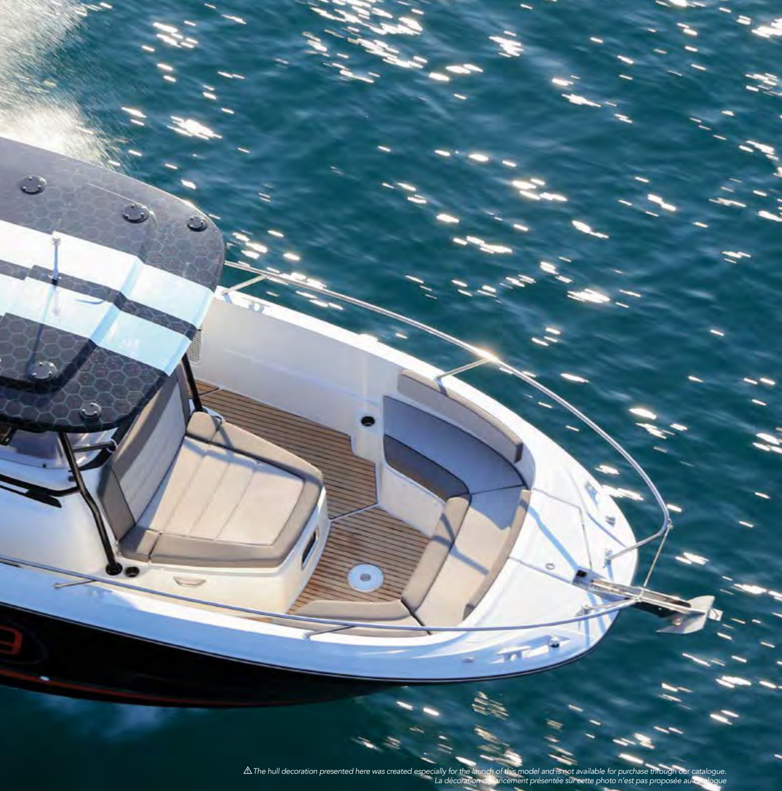
△ The hull decoration presented here was created especially for the launch of this model and is not available for purchase through our catalogue. La décoration de lancement présentée sur cette photo n'est pas proposée au catalogue

ES | La Cap Camarat 9.0 Center Console ofrece un programa de navegación múltiple para emocionantes viajes al mar en familia o con amigos. ¡Esta nueva Center Console es perfecta para combinar pesca y momentos de convivencia! La consola central muy protectora, el tablero envolvente y las 3 plazas frente al mar garantizan una gran comodidad en la navegación. En popa, el banco central profundo, un auténtico sofá y los 2 asientos plegables completan la sensación de espacio y comodidad de la gran carlinga. Esta gran carlinga de popa puede acomodar una mesa para crear un espacio de zona de estar muy agradable, pero también puede convertirse en una gran zona de sol.