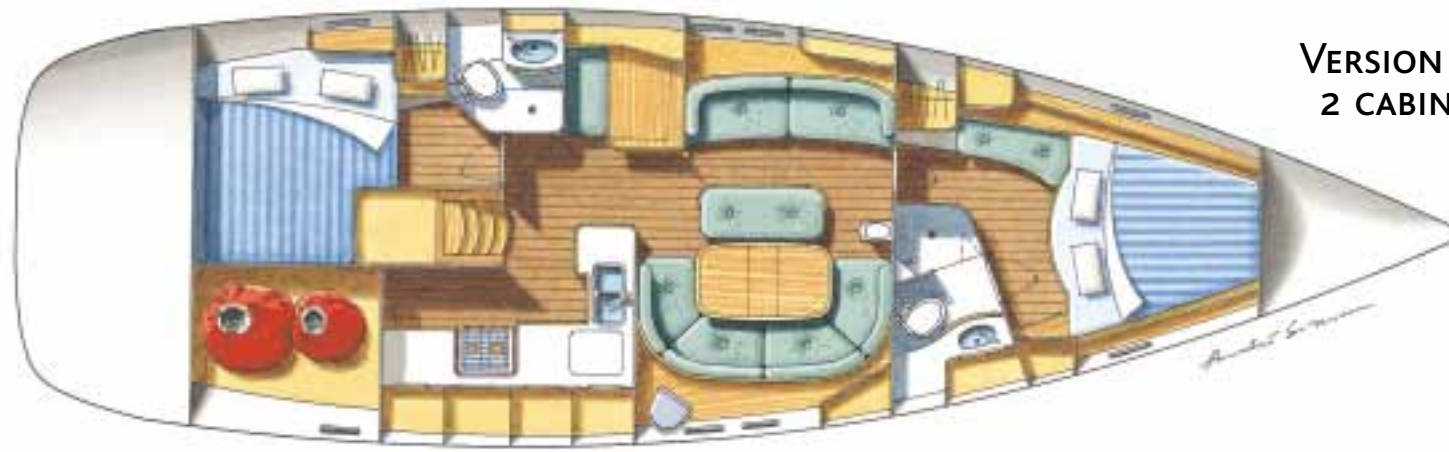
VERSION 2 CABINES 2 CABINS LAYOUT