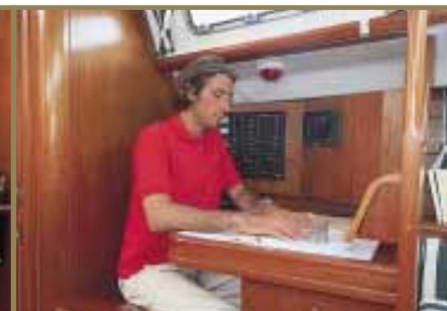
Table à carte centre de navigation Chart table nav-center