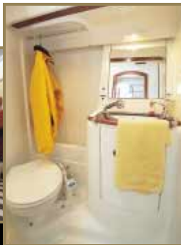
Cabinet toilette cabine avant Forward cabin head compartment