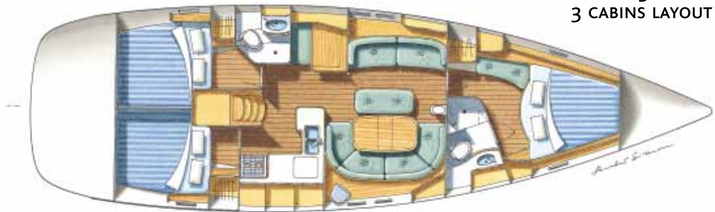
VERSION 3 CABINES 3 CABINS LAYOUT