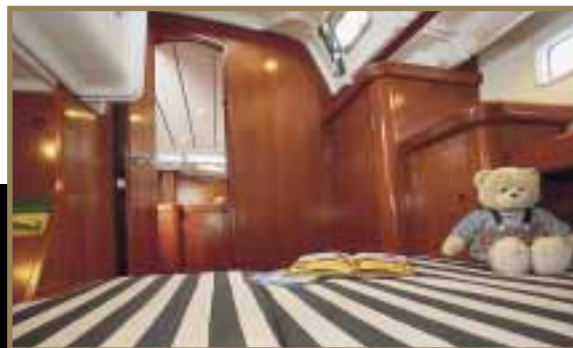
Cabine arrière tribord Starboard aft cabin