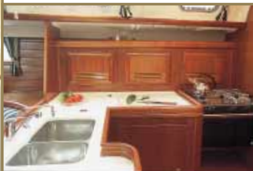
Cuisine en L L-shaped galley