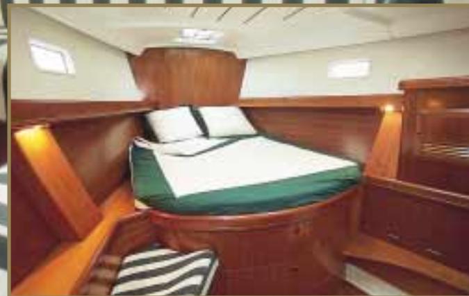
Cabine avant avec lit en îlot Island berth front cabin